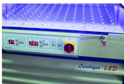
Leds de última generación para una exposición rápida y precisa. Igual a una insoladora de 5.000 W