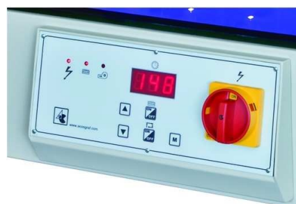
Panel de control digital capaz de memorizar hasta 10 programas diferentes