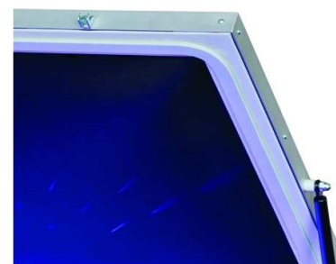
Mantilla ultra- flexible capaz de amoldarse a cualquier pantalla